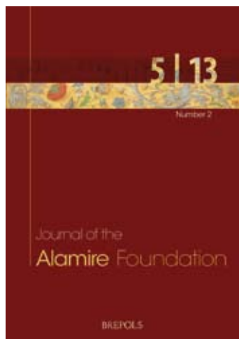
Journal of the Alamire Foundation, 5/13, number 2