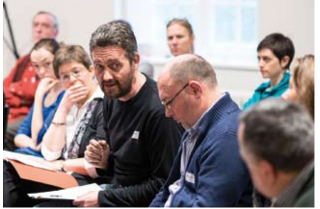
Inspiratiedag in het Huis van de Polyfonie